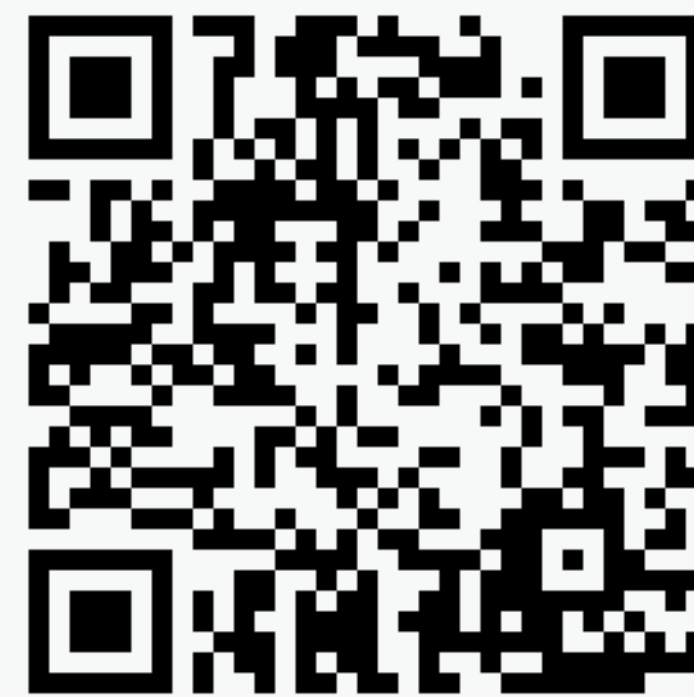
Almighty vol. 1