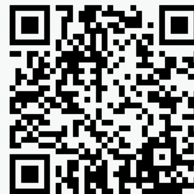
Almighty vol. 1